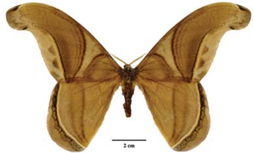
Figura 11: Rhescyntis pseudomartii Lemaire, 1976