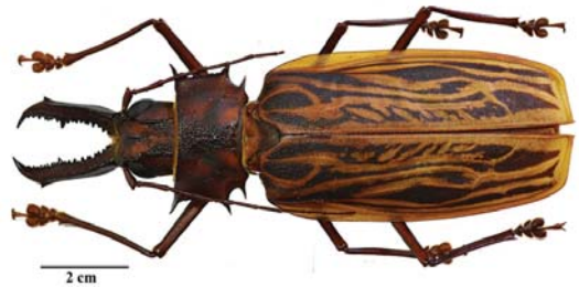
Figura 3: Macrodonia cervicornis (Linné, 1758)