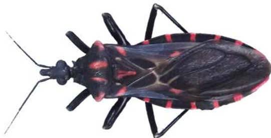
Figura 6: Panstrongylus megistus (Burmeister, 1835)