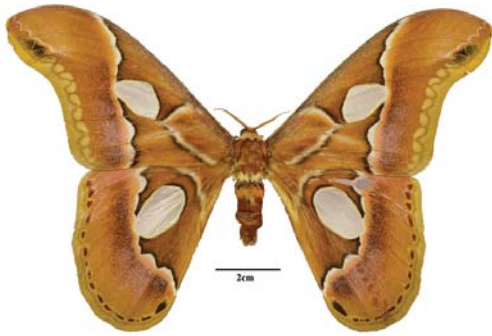
Figura 8: Rothschildia arethusa arethusa (Walker, 1855)