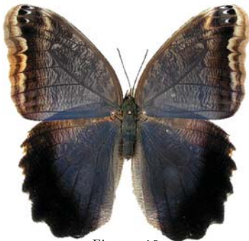
Figura 19: Caligo eurilochus brasiliensis (Felder, 1826) fêmea dorsal