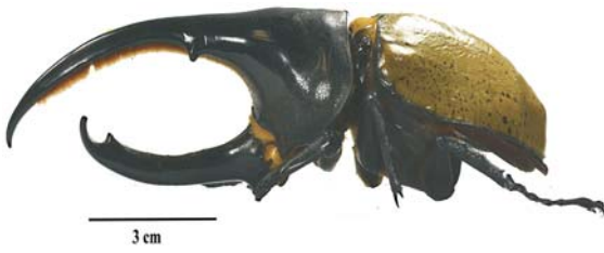
Figura 1: Disdercus hercules (Linnaeus, 1758)