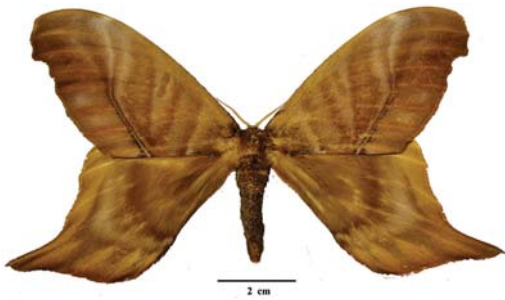
Figura 10: Paradaemonia pluto (Westwood, [1854])