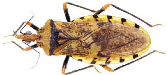
Figura 5: Panstrongylus geniculatus (Latreille, 1811)