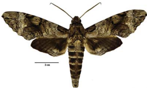
Figura 14: Pseudosphinx tetrio (Linnaeus, 1771)