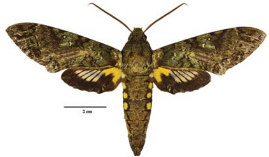
Figura 13: Amphonyx duponchel Poey, 1832