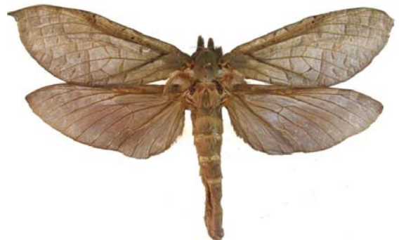
Figura 7: Trichophassus giganteus (Herrich-Schäffer, 1853)