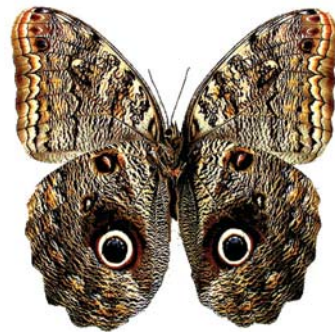
Figura 19.1: Caligo eurilochus brasiliensis (Felder, 1826) fêmea ventral