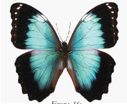
Figura 16: Morpho achilles achillaena (Hübner, 1819) macho