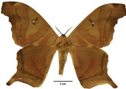
Figura 12: Titaea tarmelan tarmelan (Maassen, 1869)