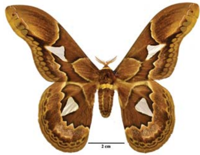
Figura 9: Rothschildia belus (Maassen, [1873])