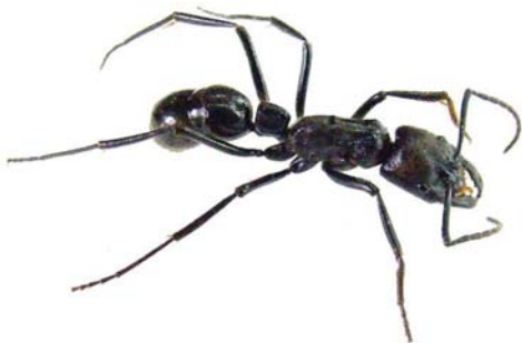
Figura 4: Dinoponera lucida Emery, 1901