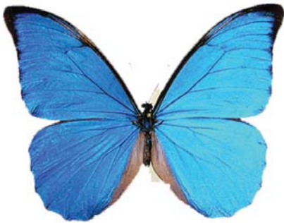
Figura 17: Morpho anaxibia Esper, 1798 macho