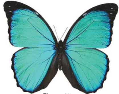
Figura 18: Morpho menelaus menelaus (Linnaeus, 1758) macho