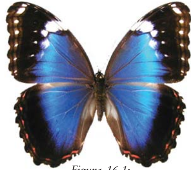
Figura 16.1: Morpho achilles achillaena (Hübner, 1819) fêmea