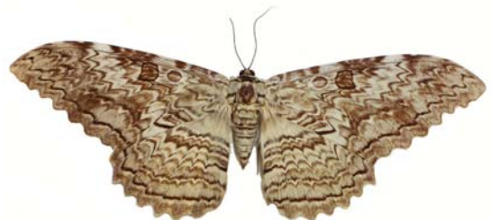
Figura 15: Thysania agrippina Cramer, 1776